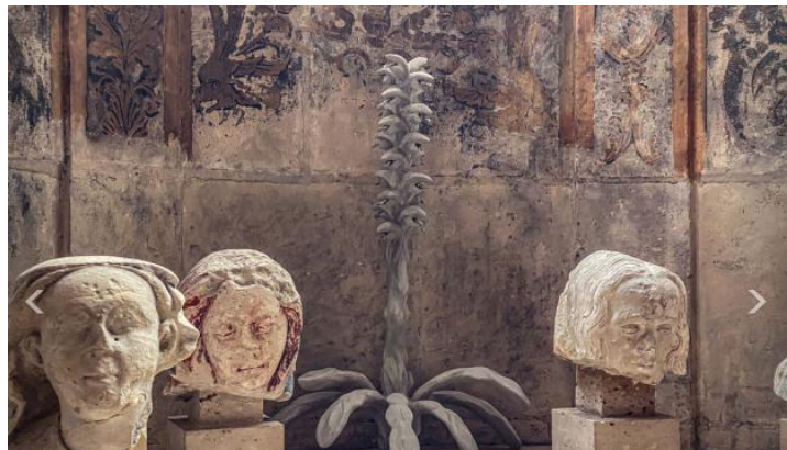
oft Acanthus, Xolo Cuintle, 2021 béton acier et étain