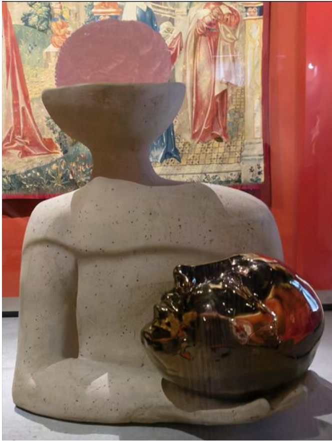
Marion Verboom Chef 2025 Cristal et céramique

Ce reliquaire prolonge l'histoire de ces objets du culte des saints dont le développement a fractionné le corps humain et créé de multiples châsses, boîtes et structures anthropomorphes pour en abriter les restes. Ouvrages et souvent vitrés pour permettre la vénération de ces fragments de substance sacrée, ces contenants opposent riche orfèvrerie et présence charnelle de la relique. L'artiste reprend cette confrontation dans une esthétique épurée et précieuse où le travail des matières, en écho à la vision médiévale du monde, superpose les mondes invisibles et tangibles.